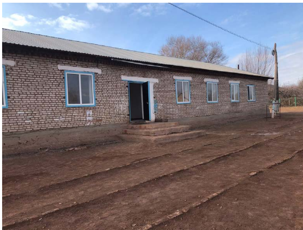
Рисунок 3. Фотографии средней школы в с. Оттук

Доработка грунта вручную в траншеях , группа грунтов 3 Перевозка грузов I класса автомобилями-самосвалами грузоподъемностью 10 т работающих вне карьера на расстояние до 10 км Засыпка вручную траншей, пазух котлованов и ям, группа грунтов 2 Дно септика Устройство бетонной подготовки Устройство круглых сборных железобетонных канализационных колодцев диаметром 2 м в грунтах сухих Установка закладных деталей весом до 4 кг КЦ20-9 КЦП 2-20 КЦД 1-20 Люк чугунный Стремянка Железнение поверхности(внутри) Гидроизоляция боковая обмазочная битумная в 2 слоя по выравненной поверхности бутовой кладки, кирпичу, бетону МАЛЫЕ ФОРМЫ Скамья с козырьком Пожарный щит с доставкой