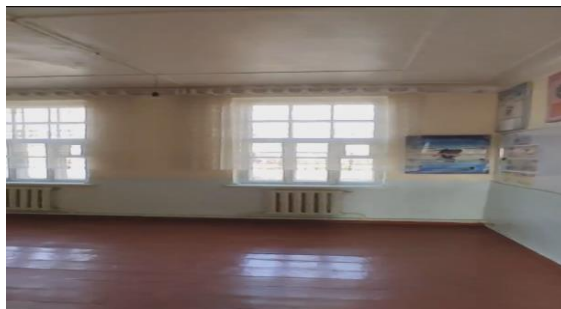
Рисунок 3. Фотографии объекта в с. Курулуш