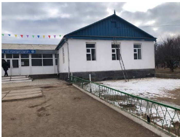
Рисунок 3. Фотографии средней школы в с. Ала-Баш

Засыпка вручную траншей, пазух котлованов и ям, группа грунтов 2 Разработка грунта вручную , группа грунтов 3 Устройство круглых сборных железобетонных канализационных колодцев диаметром 1 м в грунтах сухих Кольцо КЦ 10-9 КЦП 10-1 Люк чугунный Стремянка Гидроизоляция боковая обмазочная битумная в 2 слоя по выравненной поверхности бутовой кладки, кирпичу, бетону Уплотнение грунта пневматическими трамбовками, группа грунтов 1, 2 Разработка грунта с погрузкой на автомобили-самосвалы экскаваторами с ковшом вместимостью 0,25 м 3 , группа грунтов 3 Доработка грунта вручную в траншеях , группа грунтов 3 Перевозка грузов I класса автомобилями-самосвалами грузоподъемностью 10 т работающих вне карьера на расстояние до 10 км Устройство бетонной подготовки Устройство круглых сборных железобетонных канализационных колодцев диаметром 2 м в грунтах сухих Установка закладных деталей весом до 4 кг КЦ20-9 КЦП 2-20 КЦД 1-20 Железнение поверхности(внутри) Скамья с козырьком Пожарный щит с доставкой