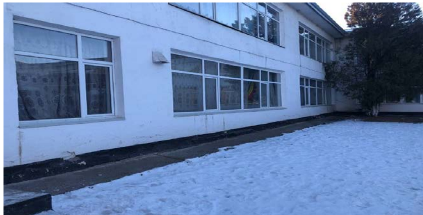
Рисунок 3. Фотографии здания

Профнастил 0,7мм Устройство желобов подвесных Желоб 3м Кронштейн