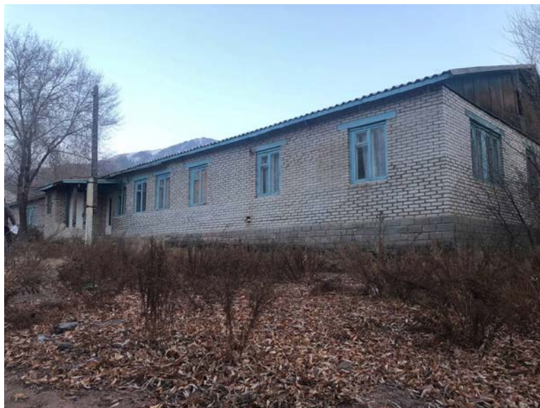
Рисунок 3. Фотографии детского сада в с. Кажу-Сай