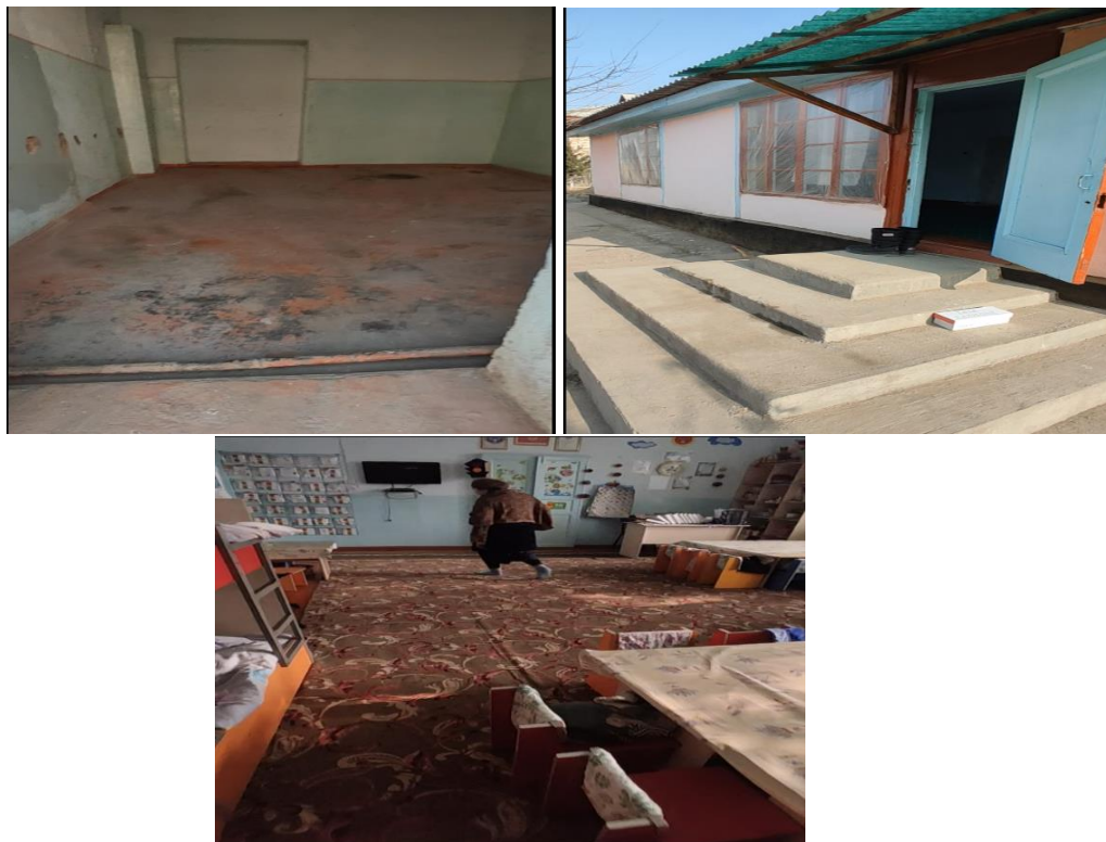
Рисунок 3. Фотографии объекта в с. Жаны Арык