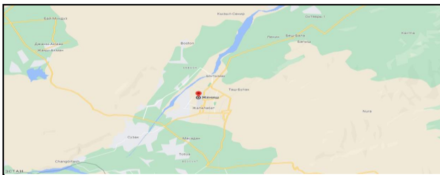
Рисунок 2. Место расположение объекта