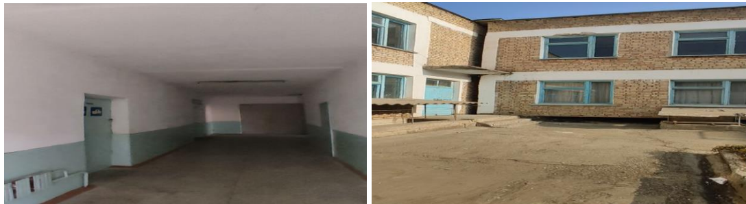
Рисунок 3. Фотографии объекта в с. Жениш