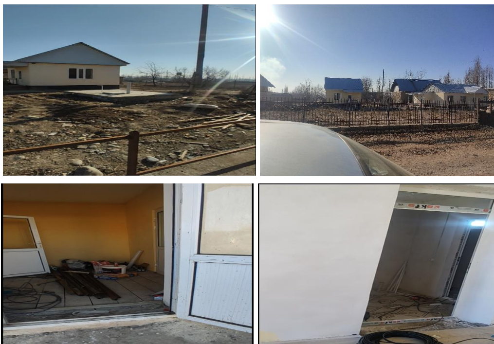
Рисунок 3. Фотографии объекта в с. Могол-Коргон