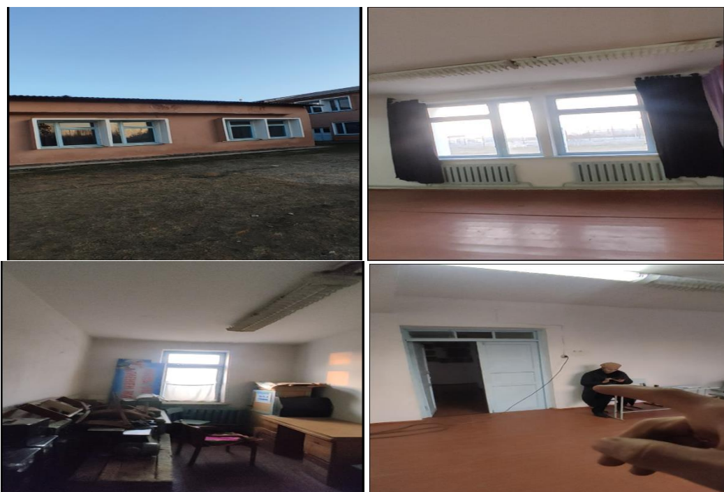
Рисунок 3. Фотографии объекта в с. Бешик-Жон