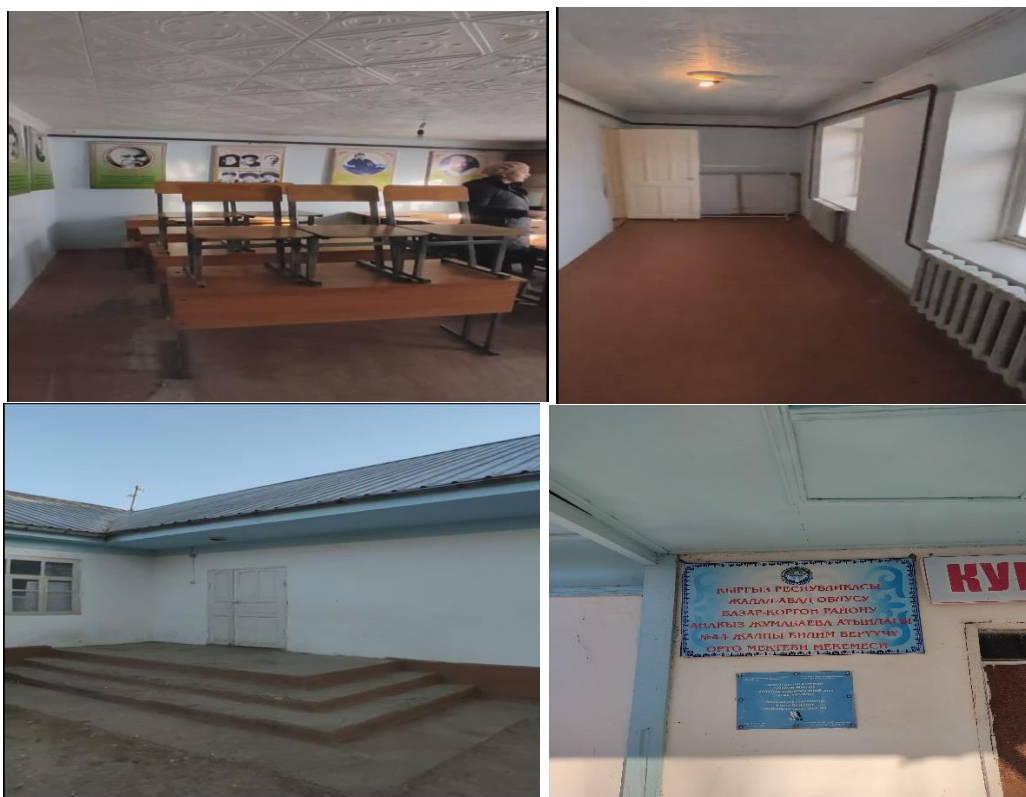
Рисунок 3. Фотографии объекта в с. Чон Курулуш