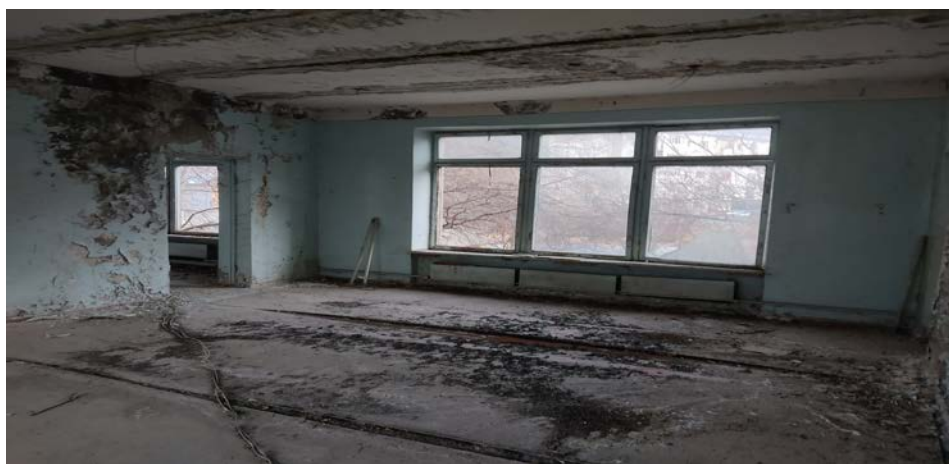
Рисунок 3. Фотографии здания в г. Кара-Куль

Засыпка вручную траншей, пазух котлованов и ям, группа грунтов 2