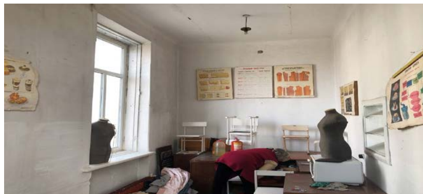
Рисунок 3. Фотографии здания