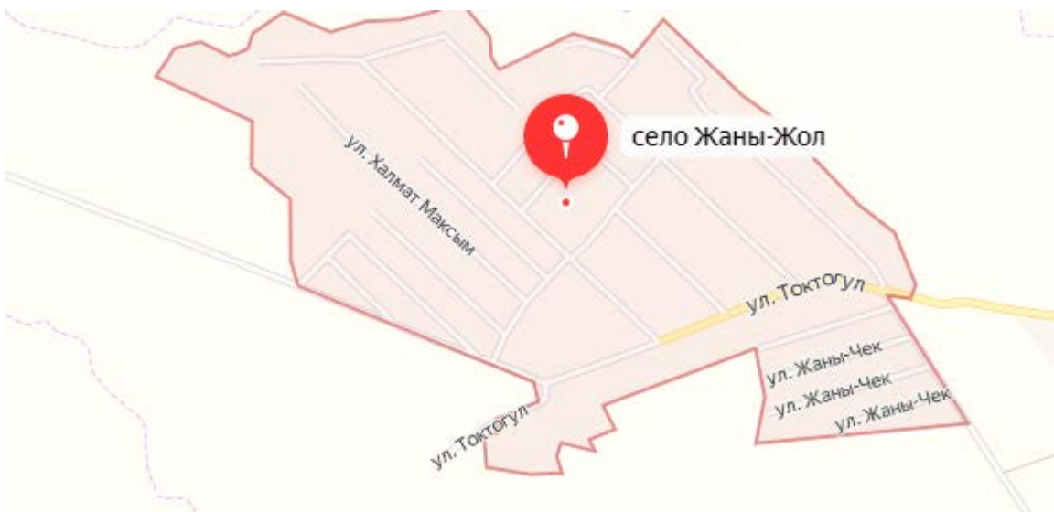
Рисунок 2. Место расположение объекта

Жаны-Жол - село в Токтогульском районе Жалал-Абадской области. Входит в состав Жаны-Жолского АО. Население составляет 2016 человек. В данном селе расположена школа. Для создания ОДС кратковременного пребывания требуется провести ремонтно-восстановительные работы в данной школе.