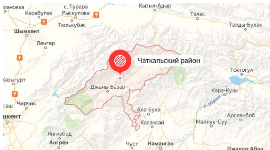
Рисунок 1. Местоположение района