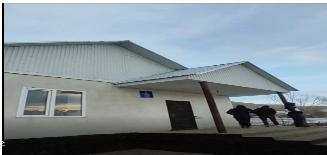
Рисунок 3. Фотографии детского сада в с. Коргон-Сай