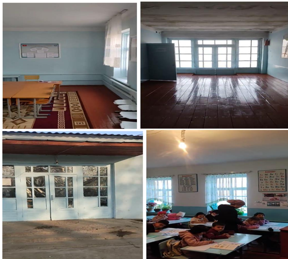
Рисунок 3. Фотографии объекта в с. Сай-Бою