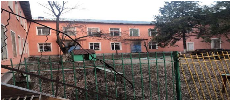
Рисунок 3. Фотографии здания

Профнастил 0,7мм Устройство желобов подвесных Желоб 3м Кронштейн