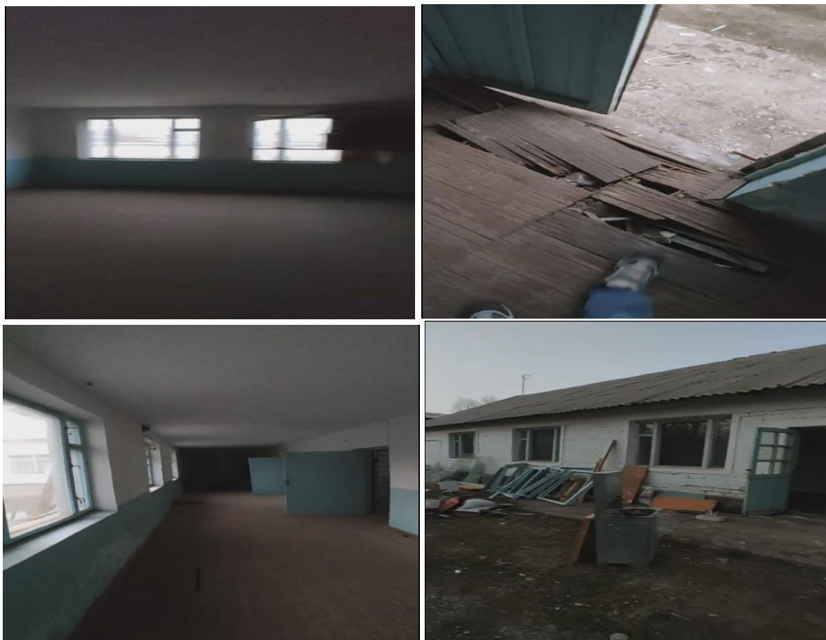
Рисунок 3. Фотографии объекта в с. Сакалды