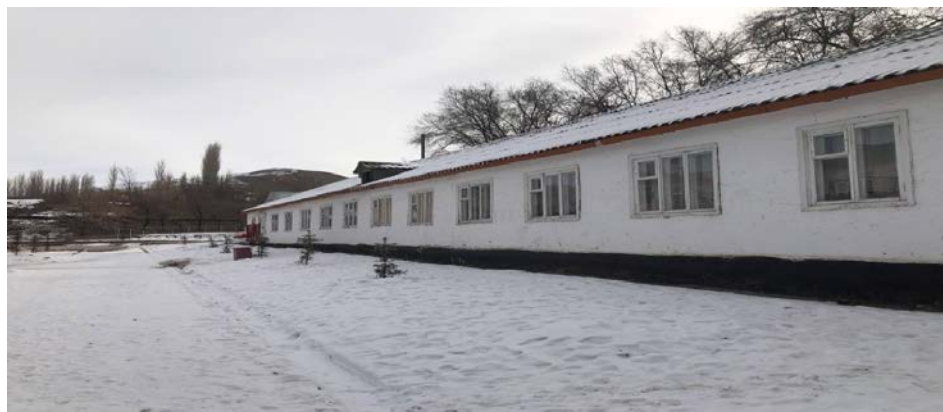
Рисунок 3. Фотографии здания

Монтаж кровельного покрытия из профилированного листа при высоте здания до 25 м Профнастил 0,7мм Устройство желобов подвесных Желоб 3м Кронштейн