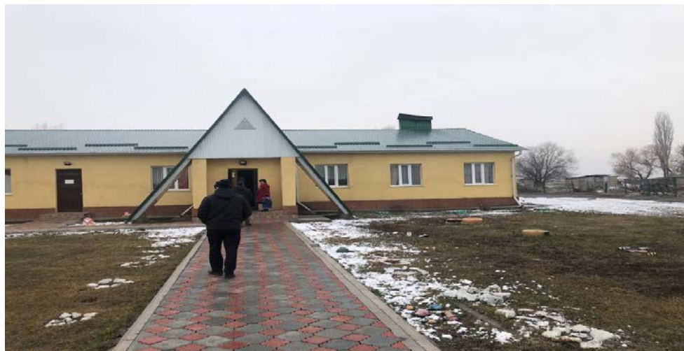
Рисунок 3. Фотографии здания детского сада

Профнастил 0,7мм Устройство желобов подвесных Желоб 3м Кронштейн