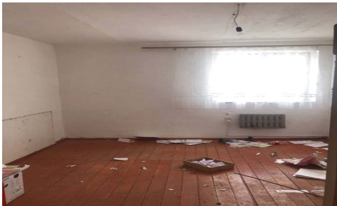
Рисунок 3. Фотографии конторы АО в с. Тепке

Перевозка грузов I класса автомобилями-самосвалами грузоподъемностью 10 т работающих вне карьера на расстояние до 10 км Засыпка вручную траншей, пазух котлованов и ям, группа грунтов 2 Уплотнение грунта пневматическими трамбовками, группа грунтов 3, 4 Устройство бетонной подготовки Устройство круглых сборных железобетонных канализационных колодцев диаметром 2 м в грунтах сухих Установка закладных деталей весом до 4 кг КЦ20-9 КЦП 2-20 КЦД 1-20 Стремянка Гидроизоляция боковая обмазочная битумная в 2 слоя по выравненной поверхности бутовой кладки, кирпичу, бетону Скамья с козырьком Пожарный щит с доставкой Устройство бетонной подготовки Устройство фундаментных плит железобетонных плоских Бетон тяжелый, крупность заполнителя 20 мм, класс В 15 (М200) Бетон тяжелый, крупность заполнителя 20 мм, класс В 20 (М250) Резервуар V=5м 3