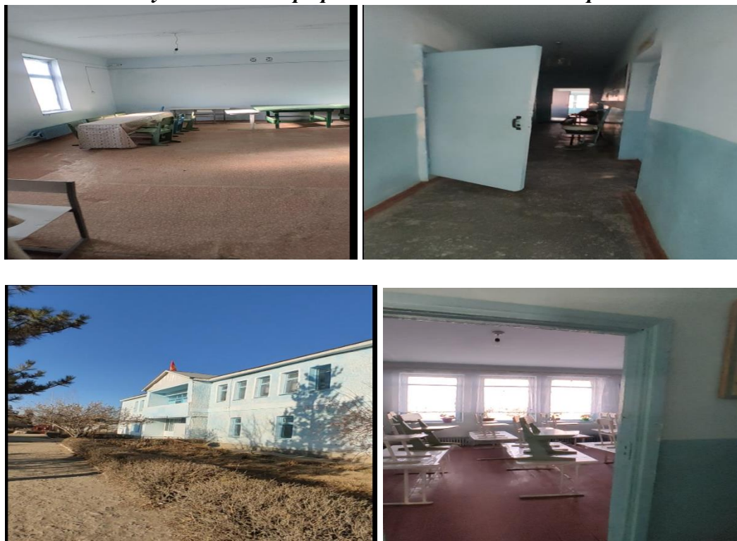
Рисунок 3. Фотографии объекта в с. Могол-Коргон