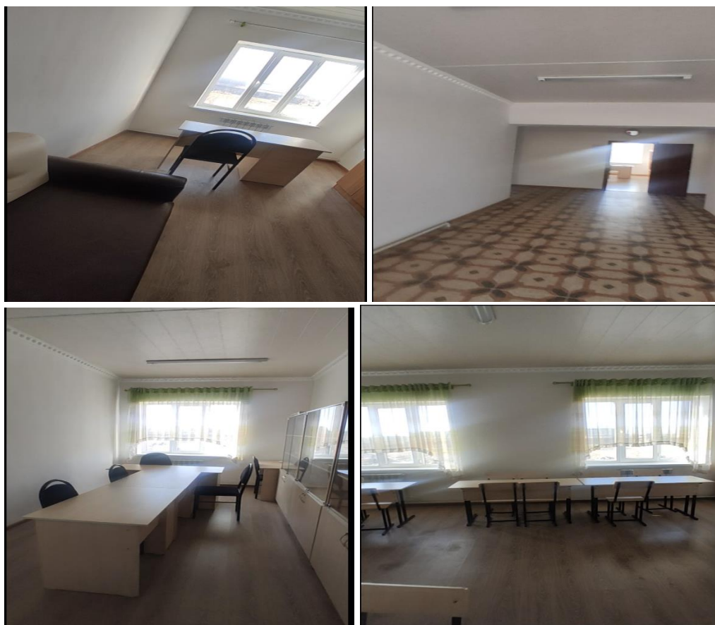
Рисунок 3. Фотографии объекта в с. Масы