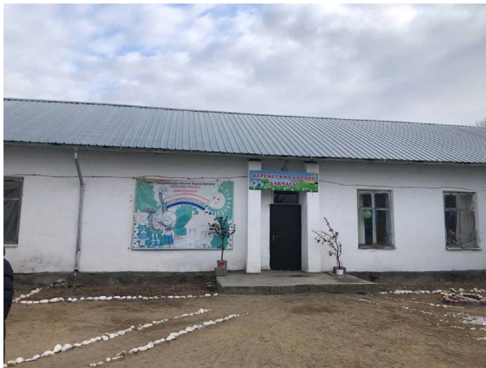
Рисунок 3. Фотографии в с. Кара-Коо