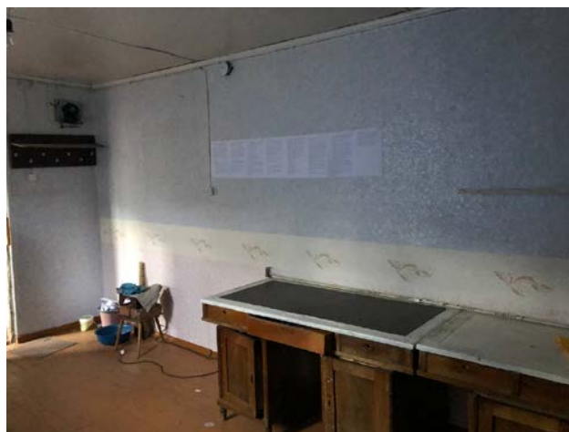
Рисунок 3. Фотографии детского сада в с. Кажу-Сай

Трубы напорные из полиэтилена низкого давления среднего типа, наружным диаметром 50 мм Укладка безнапорных трубопроводов из полиэтиленовых труб диаметром 100 мм Трубы безнапорные полиэтиленовые Утепление трубопроводов в каналах и коробах минеральной ватой Разработка грунта вручную , группа грунтов 3 Устройство круглых сборных железобетонных канализационных колодцев диаметром 1 м в грунтах сухих Кольцо КЦ 10-9 КЦП 10-1 Люк чугунный Стремянка Гидроизоляция боковая обмазочная битумная в 2 слоя по выравненной поверхности бутовой кладки, кирпичу, бетону Разработка грунта с погрузкой на автомобили-самосвалы экскаваторами с ковшом вместимостью 0,25 м3, группа грунтов 3 Доработка грунта вручную в траншеях , группа грунтов 3 Перевозка грузов I класса автомобилями-самосвалами грузоподъемностью 10 т работающих вне карьера на расстояние до 10 км Устройство бетонной подготовки Устройство круглых сборных железобетонных канализационных колодцев диаметром 2 м в грунтах сухих Установка закладных деталей весом до 4 кг КЦ20-9 КЦП 2-20 КЦД 1-20 Железнение поверхности(внутри) Скамья с козырьком Пожарный щит с доставкой