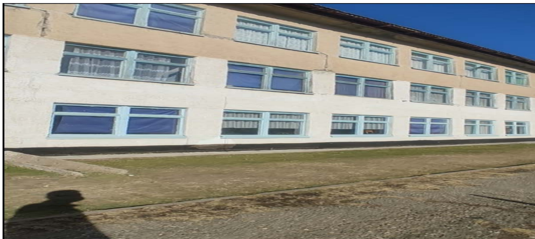
Рисунок 3. Фотографии школы в г. Кок-Жангак

МАЛЫЕ ФОРМЫ Скамья с козырьком Пожарный щит с доставкой