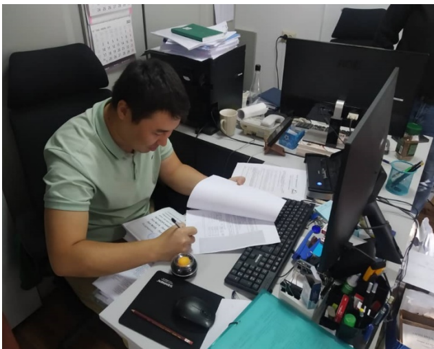
Фото 2. Кодекс поведения

Для соблюдения моральных и нравственных норм поведения и общения, разработан Кодекс поведения, который подписан специалистами ОКП а также сотрудниками основных подрядчиков, и соблюдается при реализации проектных мероприятий.