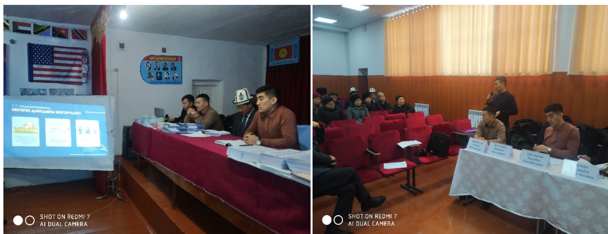
Фото 3. Консультации бенефициаров

В проекте применима система обеспечения обратной связи с бенефициарами проекта, гражданами КР, общественностью и распространения всей информации связанной с проектом, надлежащего рассмотрения жалоб и ответов и их отчетности.