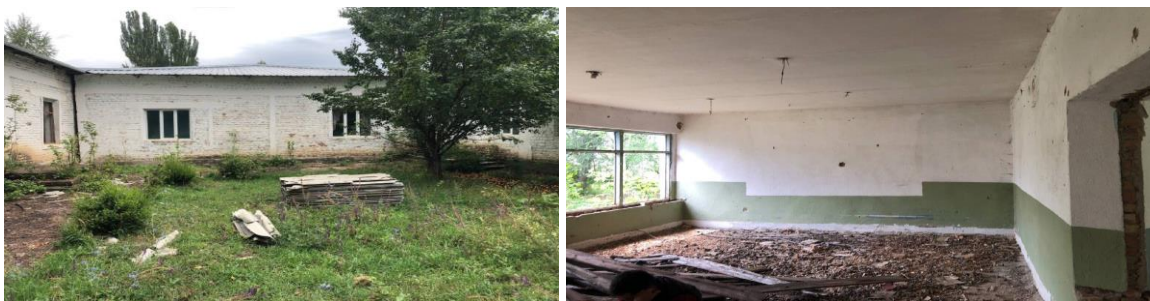
Рисунок 3. Фотографии детского сада