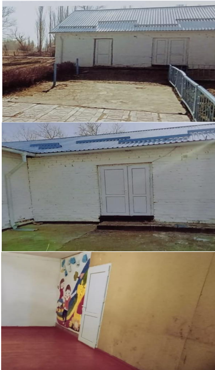
Рисунок 3. Фотографии детского сада в с. Кенеш