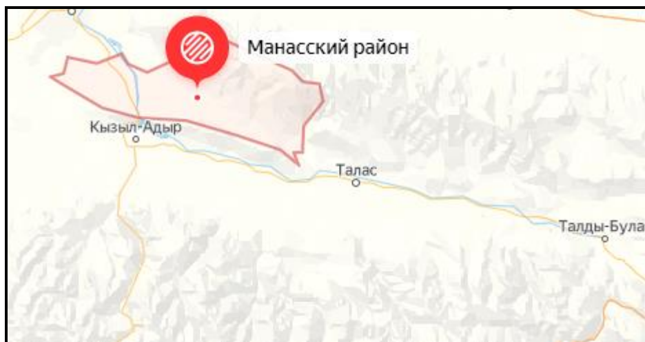
Рисунок 1. Местоположение района