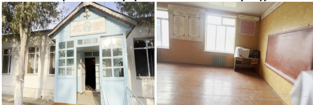
Рисунок 3. Фотографии детского сада в с. Кара-Суу