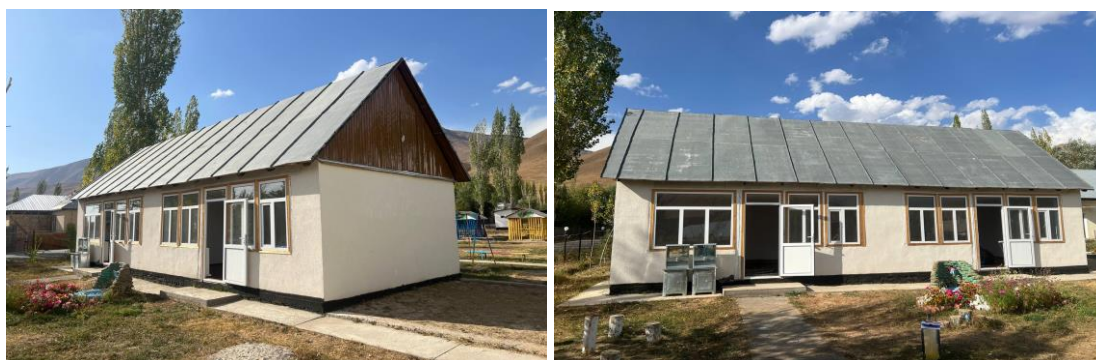
Рисунок 3. Фотографии детского сада в с. Каныш-Кыя