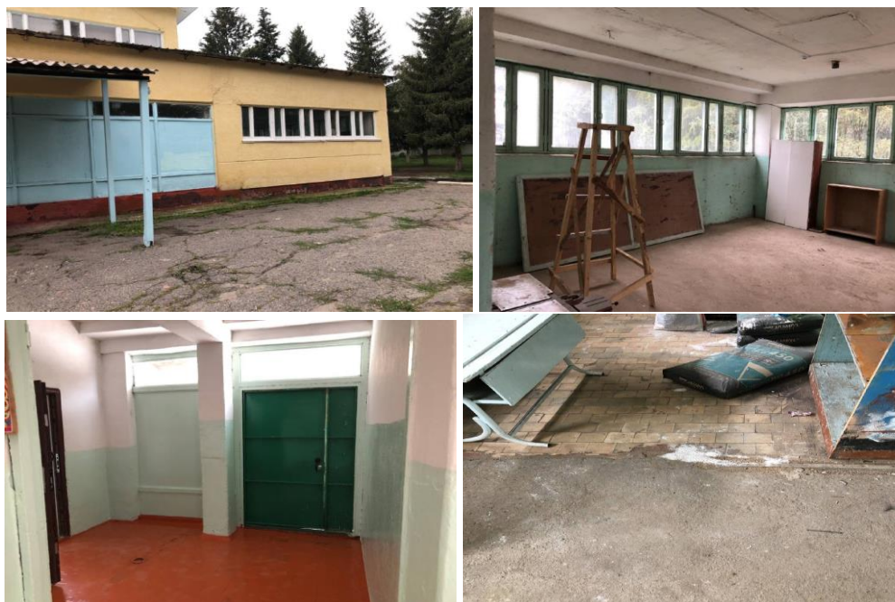
Рисунок 3. Фотографии детского сада