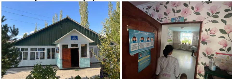
Рисунок 3. Фотографии детского сада в с. Жаны-Базар