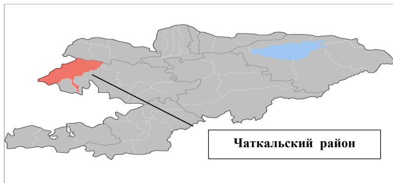
Рисунок 1. Местоположение района