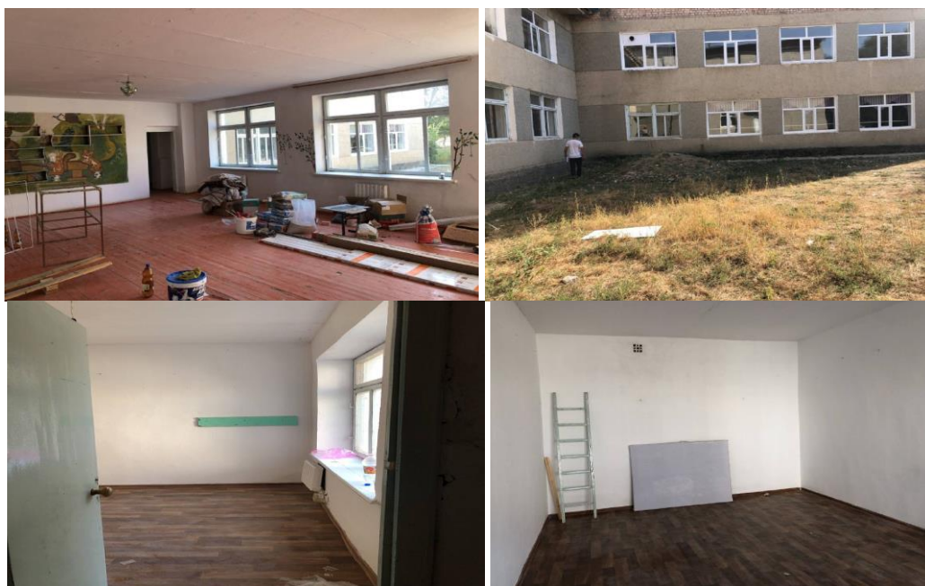
Рисунок 3. Фотографии детского сада в с. Кызыл-Адыр