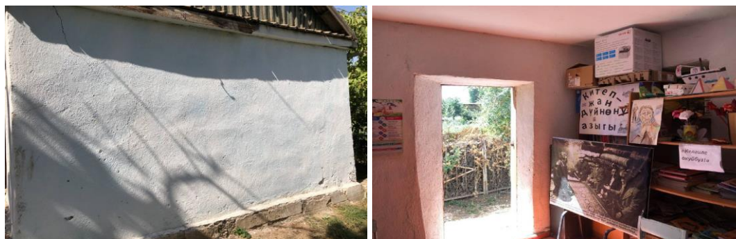
Рисунок 3. Фотографии детского сада в с. Жийде