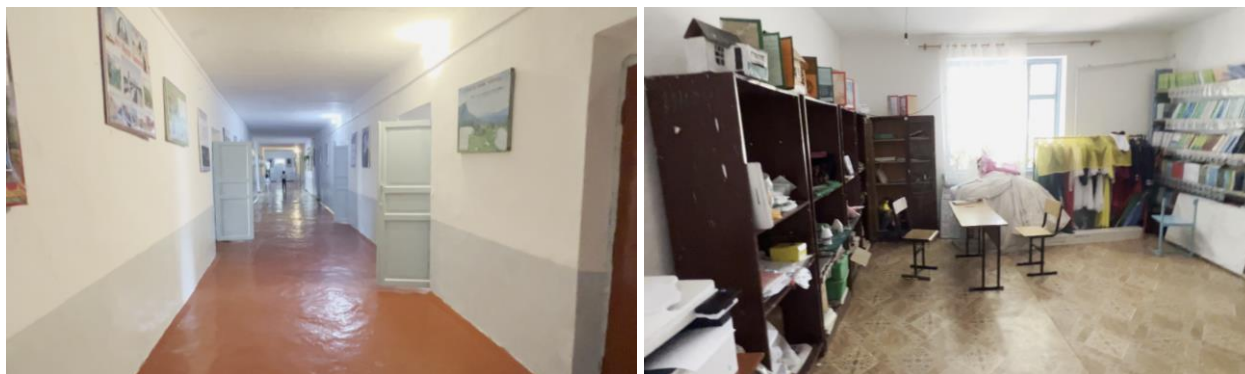
Рисунок 3. Фотографии детского сада в с. Кара-Башиат