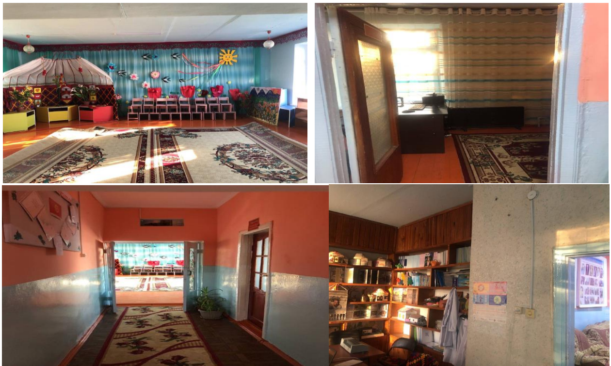
Рисунок 3. Фотографии детского сада в с. Кызыл-Адыр