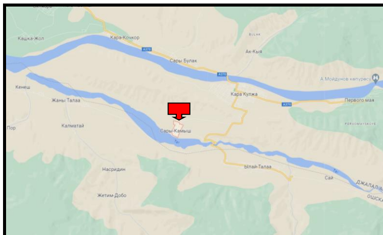
Рисунок 2. Место расположение объекта