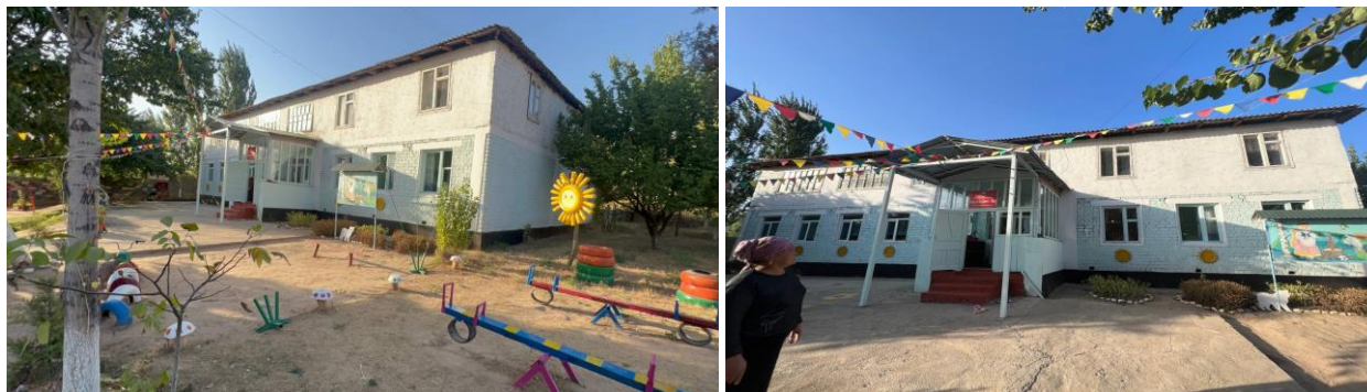
Рисунок 3. Фотографии детского сада