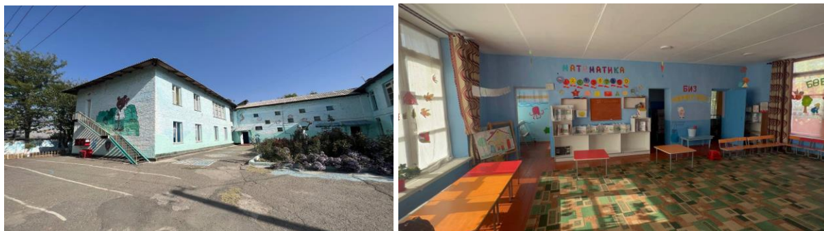
Рисунок 3. Фотографии детского сада