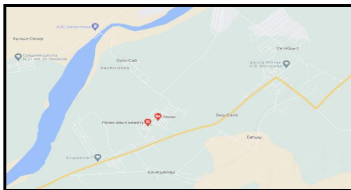
Рисунок 2. Место расположение объекта

Село Ленин расположено в Сузакском районе Джалал-Абадской области Кыргызской Республики. Центр Ленинского аильного округа. По данным переписи в селе проживает 3598 человека. В данном селе расположено здание детского садика. Для создания ОДС кратковременного пребывания в вышеуказанном здании требуется провести ремонтно-восстановительные работы.