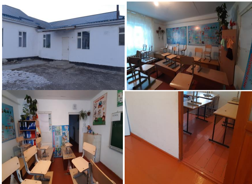
Рисунок 3. Фотографии детского сада