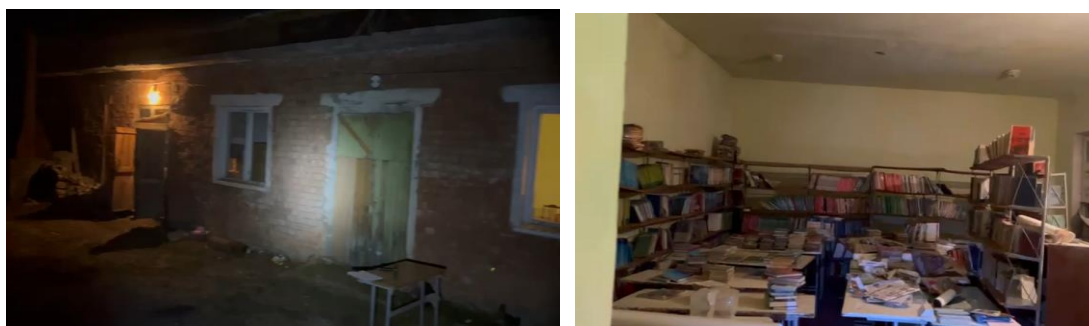
Рисунок 3. Фотографии здания