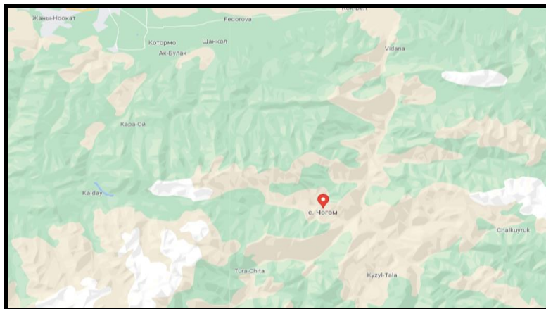
Рисунок 2. Место расположение объекта

Село Чогом — село в составе Араванского района Ошской области Кыргызской Республики. По данным переписи в селе проживает 2536 человека. В данном селе расположено здание школы и для создания ОДС кратковременного пребывания в вышеуказанном здании требуется провести ремонтно-восстановительные работы.