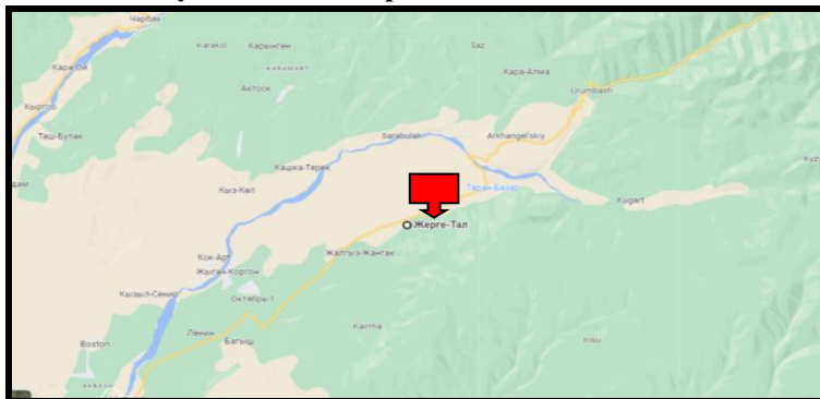
Рисунок 2. Место расположение объекта

Село Жерге-Тал расположено в Сузакском районе Джалал-Абадской области Кыргызской Республики. По данным переписи в селе проживает 2051 человек. В данном селе расположено здание детского садика. Для создания ОДС кратковременного пребывания в вышеуказанном здании требуется провести ремонтно-восстановительные работы.