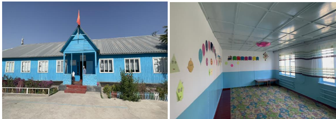
Рисунок 3. Фотографии детского сада