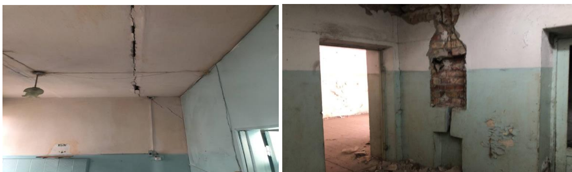
Рисунок 3. Фотографии здания