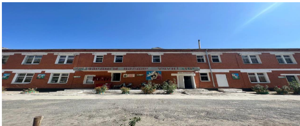
Рисунок 3. Фотографии детского сада