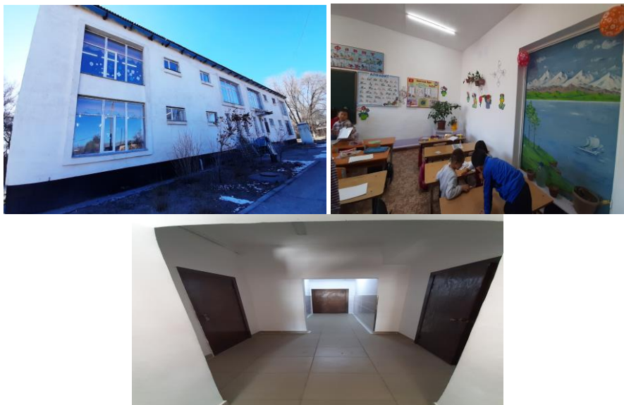
Рисунок 3. Фотографии детского сада