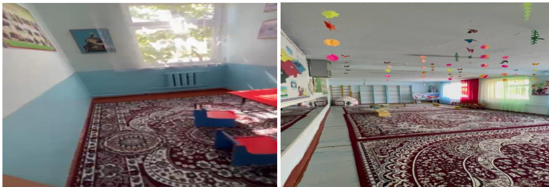
Рисунок 3. Фотографии детского сада