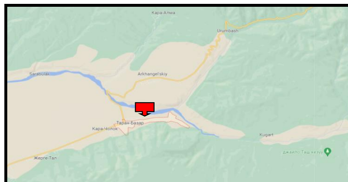
Рисунок 2. Место расположение объекта

Село Таран-Базар расположено в Сузакском районе Джалал-Абадской области Кыргызской Республики. Входит в состав Курманбековского аильного округа. По данным переписи в селе проживает 3522 человека 3 . В данном селе расположено здание детского садика. Для создания ОДС кратковременного пребывания в вышеуказанном здании требуется провести ремонтно-восстановительные работы.