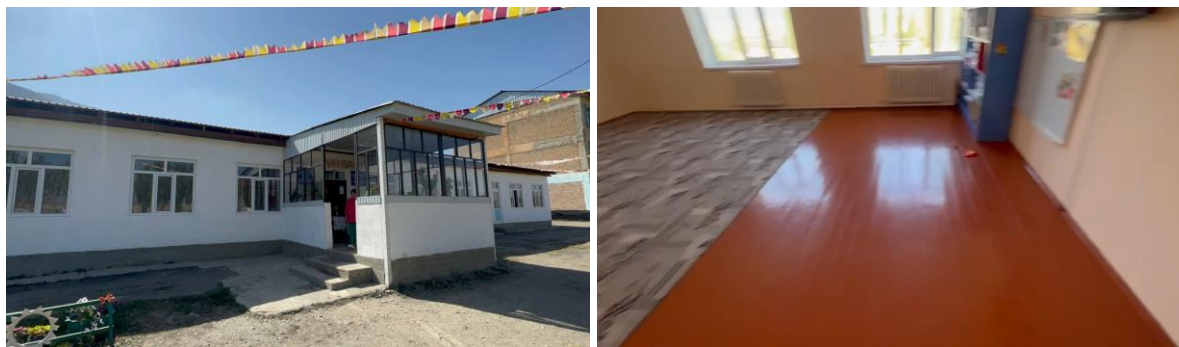
Рисунок 3. Фотографии детского сада