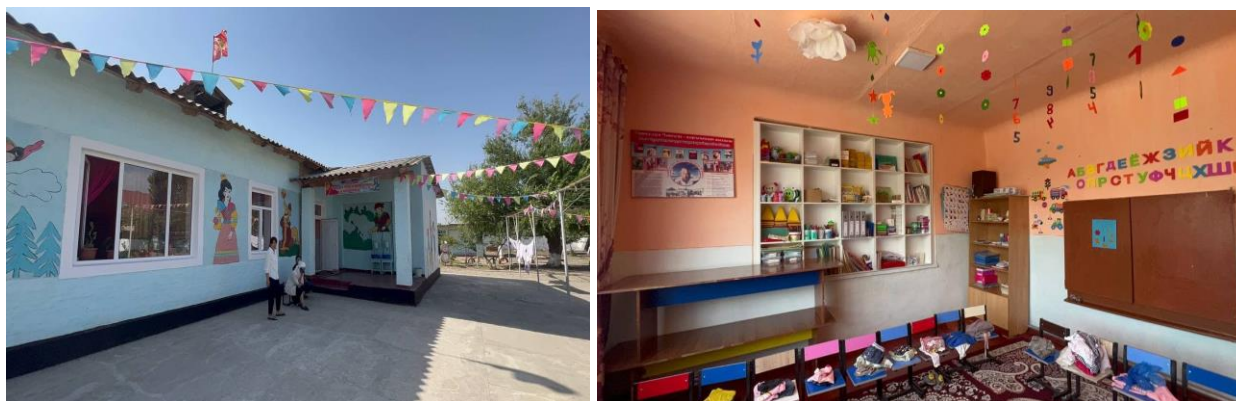
Рисунок 3. Фотографии детского сада