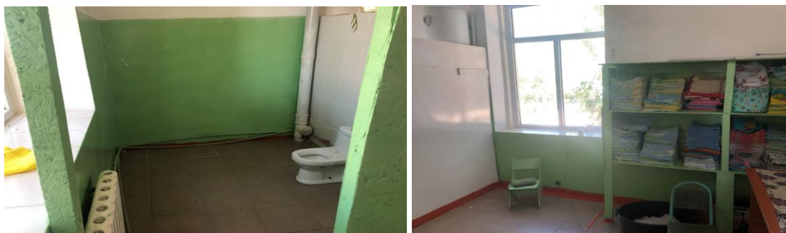
Рисунок 3. Фотографии детского сада