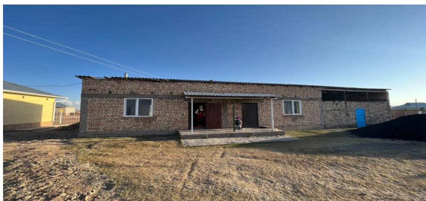
Рисунок 3. Фотографии здания