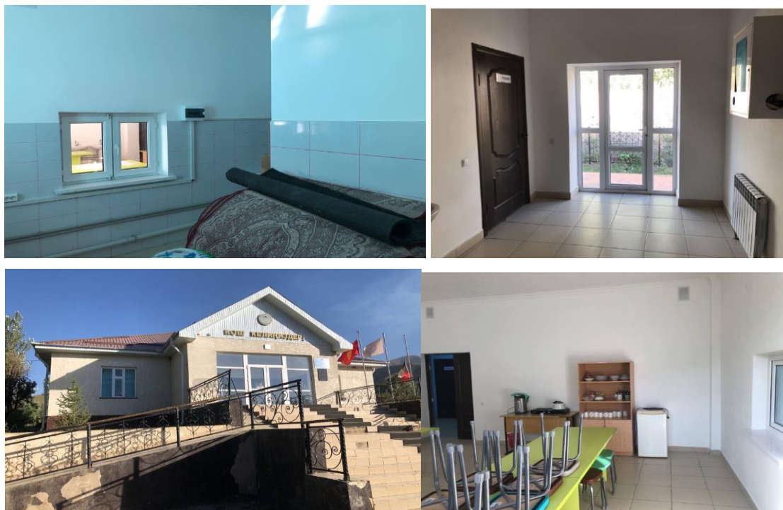
Рисунок 3. Фотографии детского сада